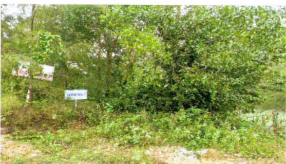
รูปที่ 7 บ่อดักตะกอนดินที่ 1