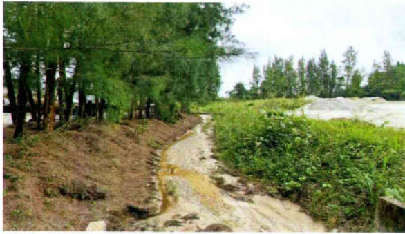
รูปที่ 9 คันทำนบดิน ขุดคูน้ำและคันสนปลูกไว้รอบเขตโรงโม่