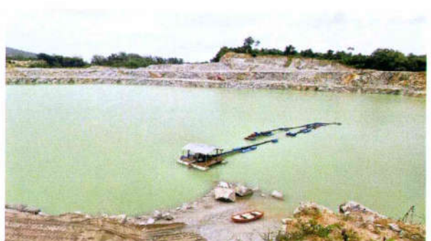
รูปที่ 6 บ่อดักตะกอนดินบริเวณหน้าเหมือง ก่อนระบายสู่บ่อดักตะกอน