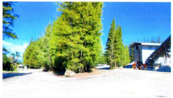
รูปที่ 10 แนวคันสนสองข้างถนนภายในโรงโม่หินติดตั้ง