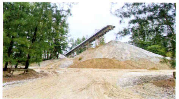
รูปที่ 4 เปลือกดินและเศษหิน นำเข้าโมเพื่อผลิตเป็นหินคลุก