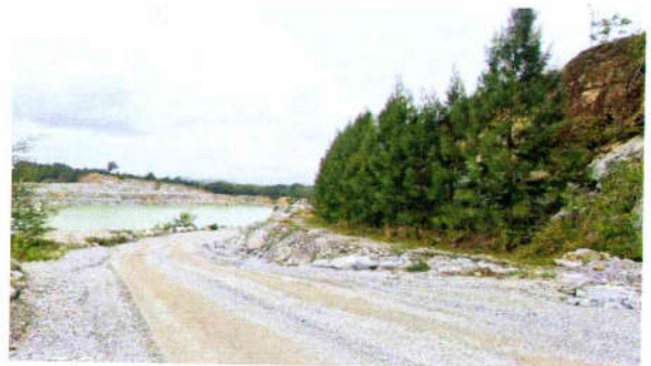
รูปที่ 22 ปลุกและดูแลรักษาต้นไม้ในส่วนพื้นที่ที่ไม่มีการ ทำเหมืองแล้ว