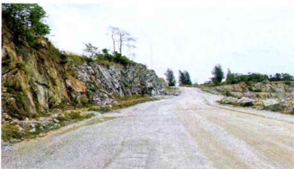
รูปที่ 5 เส้นทางถ้ำเลียงแร่ ทำหน้าที่เสมือนคันทำนบเพียงบน น้ำให้ไหลลงสู่บ่อดักตะกอน