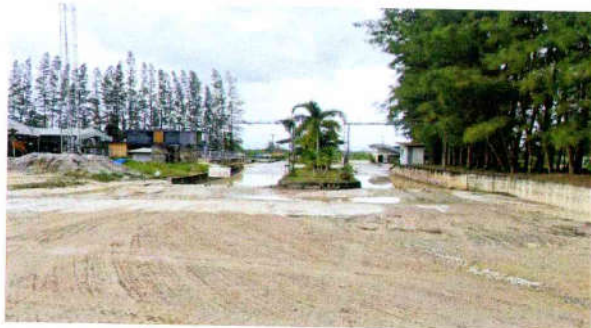
รูปที่ 19 บ่อล้างล้อและระบบสปริงน้ำ