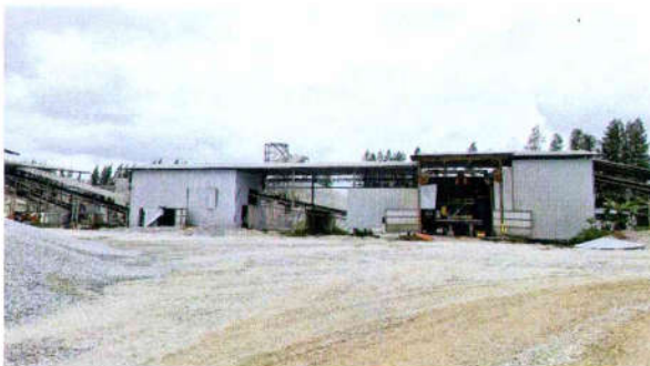
รูปที่ 13 ติดตั้ง Metal Sheet ปิดคลุมอาคารโรงโม่หิน