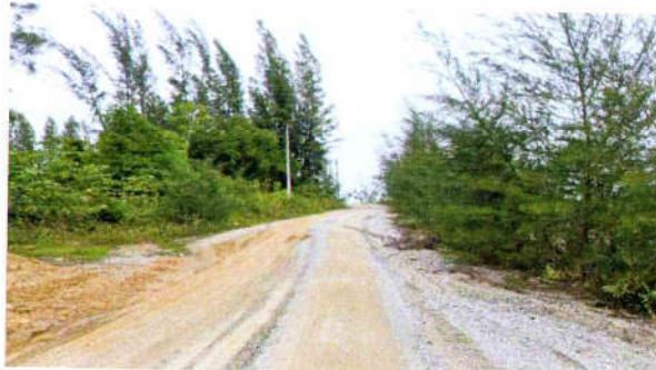
รูปที่ 21 ปลุกและดูแลรักษาต้นไม้ในส่วนพื้นที่ที่ไม่มีการ ทำเหมืองแล้ว