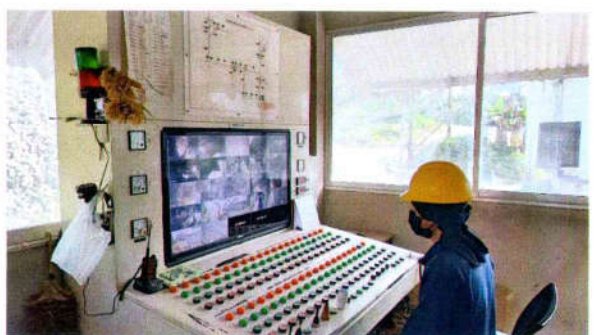
รูปที่ 16 ระบบกล้องวงจรปิดเพื่อตรวจสอบกระบวนการโม่ และควบคุมฝุ่นละออง