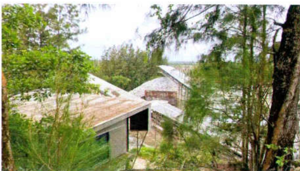
รูปที่ 15 ติดตั้ง Metal Sheet ปิดคลุมสายพานลำเลียง