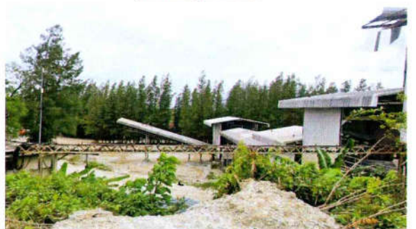
รูปที่ 14 ติดตั้ง Metal Sheet ปิดคลุมอาคารโรงโม่หิน