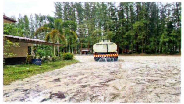
รูปที่ 2 รถบรรทุกน้ำฉีดพรมเส้นทาง