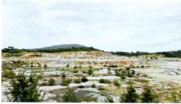
รูปที่ 1 ลักษณะหน้างานแบบขั้นบันได