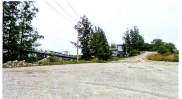
รูปที่ 12 Metal Sheet ปิดคลุมอาคารโรงโม่หิน