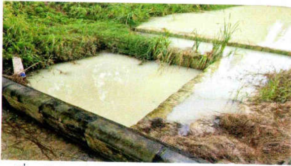
รูปที่ 17 บ่อคอนกรีตสำหรับดักตะกอนดินบริเวณโรงโม่หิน