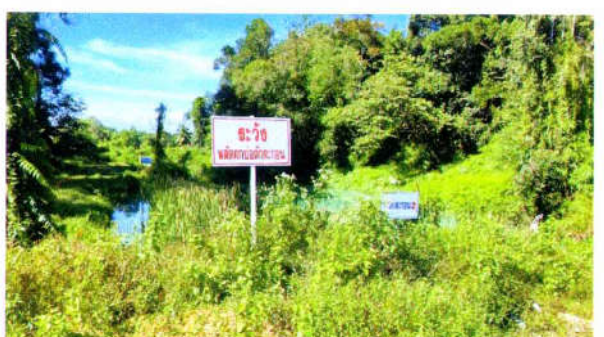
รูปที่ 8 บ่อดักตะกอนดินที่ 2-5