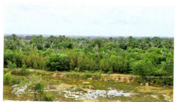
รูปที่ 24 ปลุกและดูแลรักษาต้นไม้ในส่วนพื้นที่ที่ไม่มีการ ทำเหมืองแล้ว