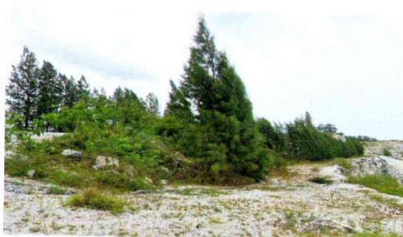
รูปที่ 23 ปลุกและดูแลรักษาต้นไม้ในส่วนพื้นที่ที่ไม่มีการ ทำเหมืองแล้ว