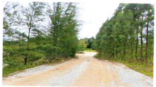
รูปที่ 20 ปลุกและดูแลรักษาต้นไม้ในส่วนพื้นที่ที่ไม่มีการ ทำเหมืองแล้ว