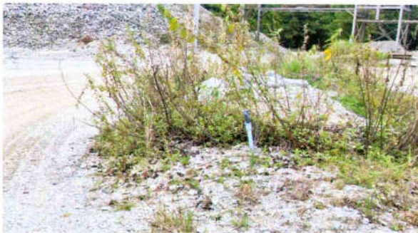
รูปที่ 11 ระบบ Sprinkle บริเวณภายในโรงโม่หิน