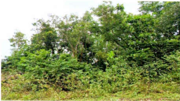
รูปที่ 3 พื้นที่ที่ยังเดินทางเข้าไม่ถึง จะปล่อยให้พันธุ์ไม้ เดิมตามธรรมชาติเจริญเติบโตต่อไป